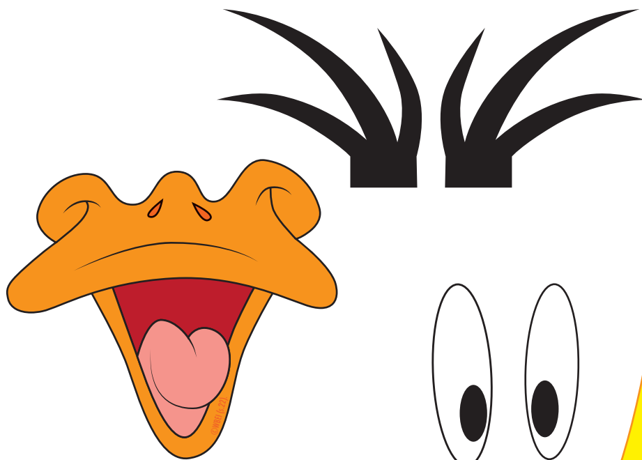
Parti di Daffy Duck